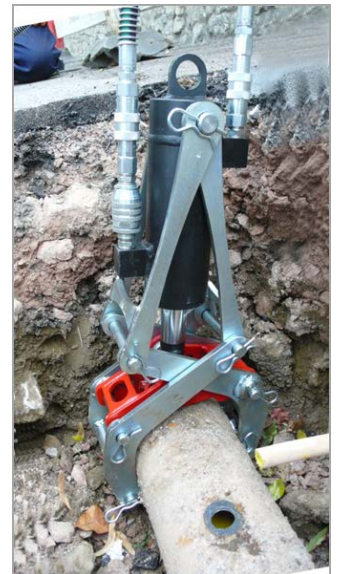
Øverste billed: Mini-Rør-Knuser placeret på 6" støbejerns rør der er relinet med PE.

Mini-Rør-Knuser kan tilpasses til rør fra 4" til 8" værktøjet er meget nemt at tilpasse til de enkelte rørstørrelser uden brug af speciel værktøj.