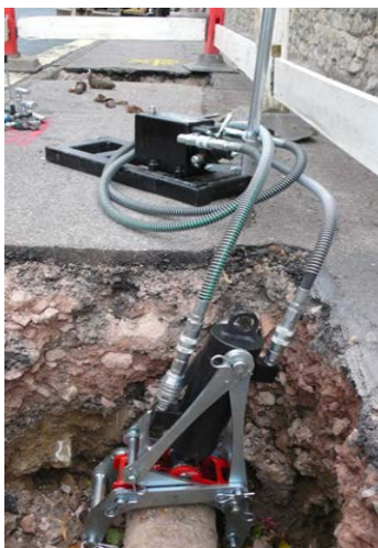
Billed til venstre: Mini-Rør-Knuser placeret på 6" støbejern på vanskelig tilgængeligt rør med anvendelse af håndpumpe.