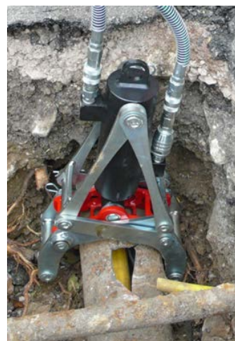
Billed til Venstre: Mini-Rør-Knuser er ved at knuse en 6" støbejernsledning med ø 75 mm PE